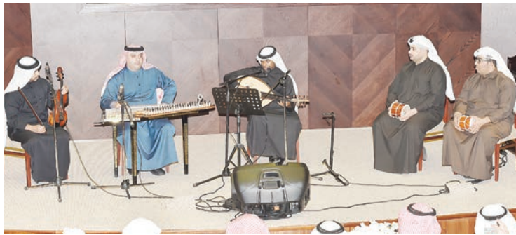
فرقة الغناء القديم قدمت أشهر أغاني فضالة