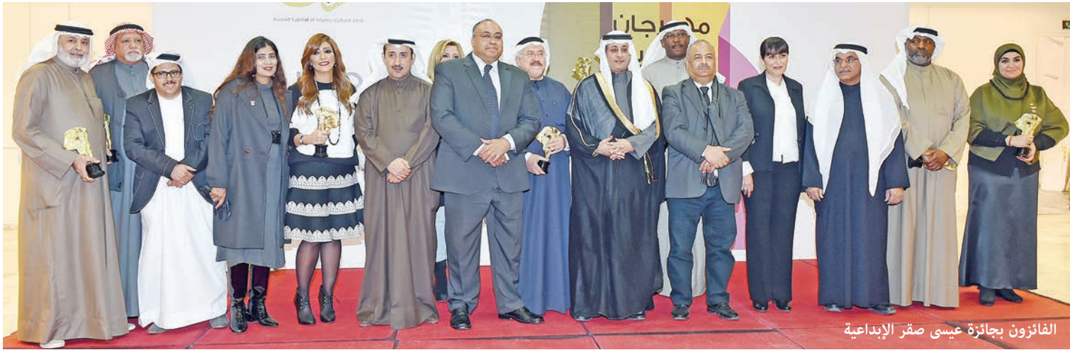
الفائزون بجائزة عيسى صقر الإبداعية