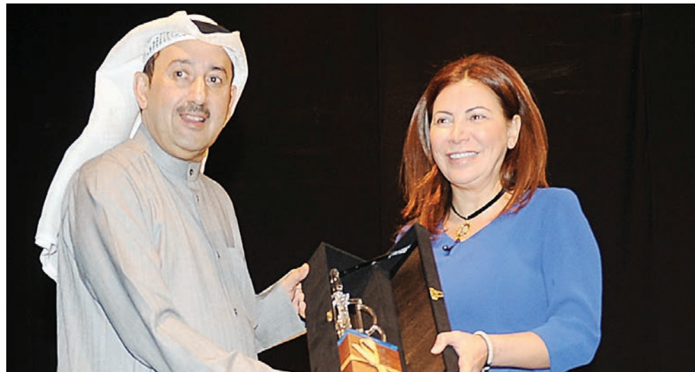
العسوسي مكرماً رائدة طه

يتسع فضاء المسرح... ويضيئ، بينما الفنانة رائدة طه تقف شامخة تروي قصة كفاح عائلة تمكنت من أن تغير خيوط الحياة، تلك الخيوط التي كانت تريد أن تجذبها ناحية الضياع، إلا أن تماسك الأم والأبناء جعل اتجاه الخيوط يسير في طريق النجاح الذي حدث بشدة في غياب المعيل الوحيد (الأب الشهيد).