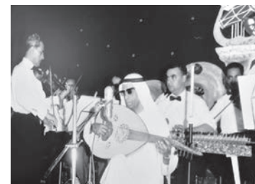
محطات من حياة الفنان الراحل