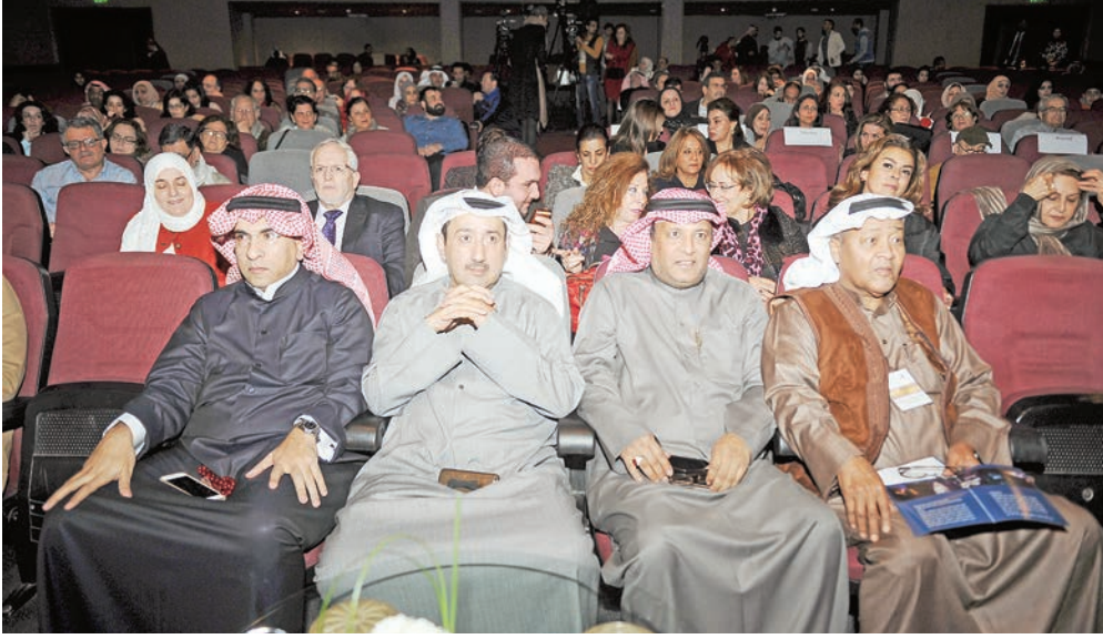
جانب من الجمهور