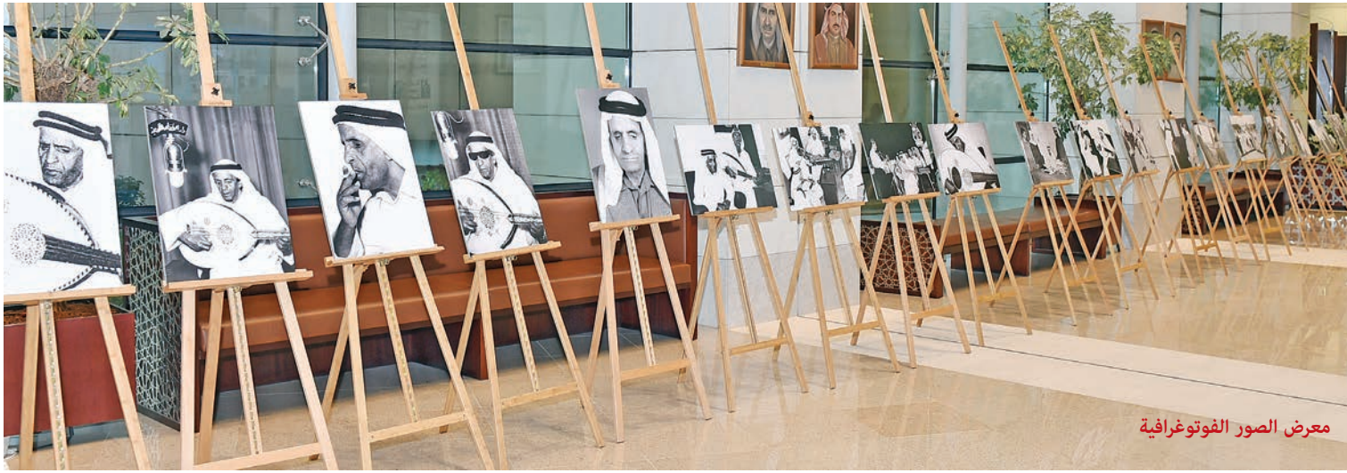
معرض الصور الفوتوغرافية

الكويتية، الإذاعية منها والتلفزيونية وفي شتى المجالات، من أبرز أعماله: «رب الملا - خذوني معاكم - سيدي يا زين - طول الدهر سهران - كان الروض يجمعنا - طال هجر الحيايب - دنياك لو طالت - على يو دان - عيدنا عيد الوطن - ياللي أسرت الفؤاد - الصبر أجييه منين - تمر الليالي - أنا ودي ولكن ما حصل لي - أسمر عشقته - مر الزمان وفات - أعلل نفسي في الغرام - هلت دموع العين - أيا معشر الأحباب - أنا البارحة - أحمد الله وأشكره» وأعمال أخرى كثيرة.